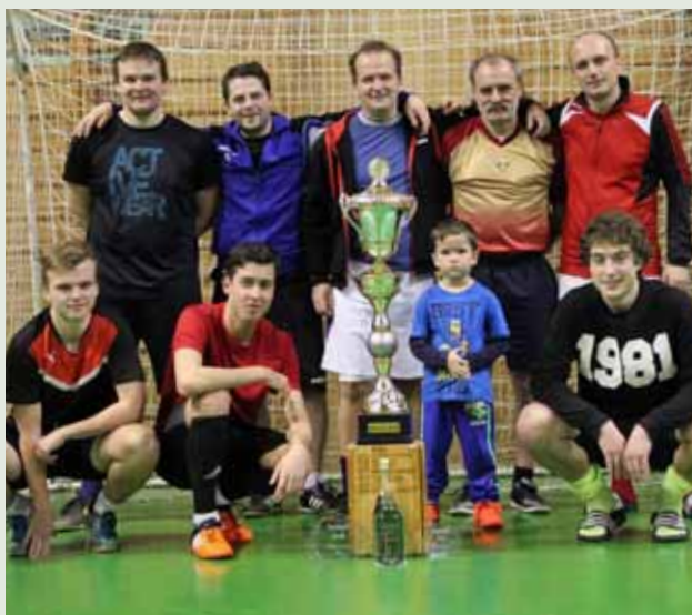
Vítězové: Dolní konec – Kobylská