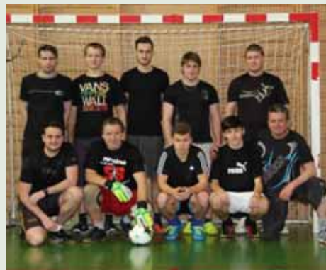
Bečvice – Přehrada