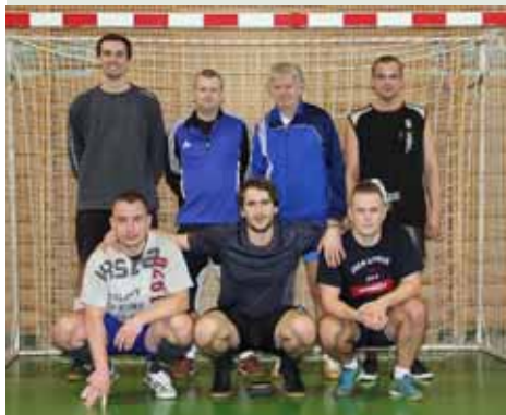
2. místo Bučkové