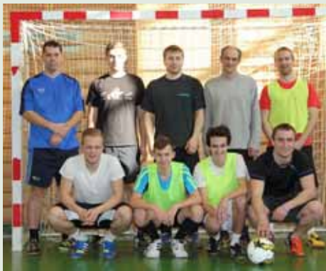
3. místo Hluboké