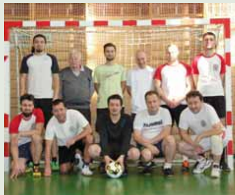
Mečůvka – Valaška – Luky