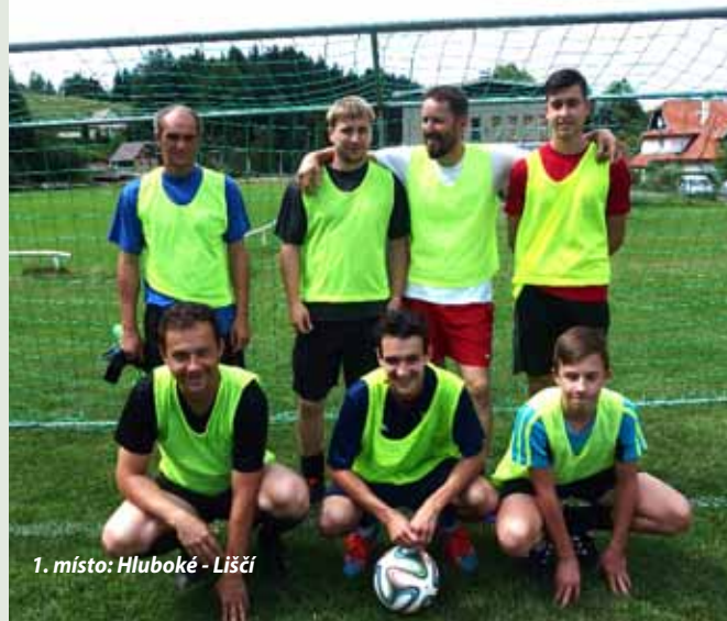
1. místo: Hluboké - Liščí

Turnaj se hrál za krásného slunečného počasí, jen divácká kulisa mohla být početnější. Fotbalové odpoledne se určitě vydařilo a všichni fotbaloví příznivci se už těší na začátek soutěží. Marie Němcová